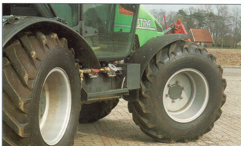
De Systra kent voorwiel-, achterwiel-, vierwielbesturing en hondegang