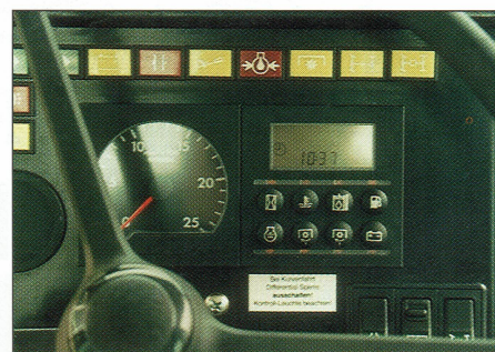
Tot de verbeteringen die Egelseer aangebracht behoort onder meer een eenvoudige boordmonitor

montagehal. Maar als de verwachtingen uitkomen, zal de productie zo'n 100 tot 120 stuks per jaar gaan bedragen. Dit baseert het bedrijf mede op de aanvragen die uit onder meer Frankrijk binnenkomen. Egelseer gaat daarom binnenkort een nieuwe productiehal bouwen. Dan zal moeten blijken of er in Europa voldoende volhouders te vinden zijn om Egelseer als nieuwe fabrikant van 'bärenstarken' Schlüter Traktoren in de markt te houden. □