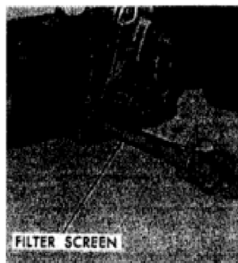
Fig. 226- Weergave met transmissiepompfilter scherm dat wordt verwijderd van model 2000, 3000 en 4000 trans on. missi