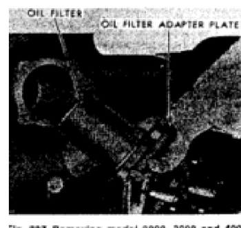
Fig. 227- Het verwijderen van model 2000, 3000 en 4000 Select-O-Speed transmissie oliefilter element en adapter plaat (cover). demonteer element van behuizing.