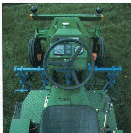
Het goede overzicht op middenhef maakt de trekker bijzonder geschikt voor verzorgingswerkzaamheden

Een eerlijke vergelijking met een 'normale' trekker is moeilijk. Het lage bodemgewicht en de grote bodemvrijheid maken deze trekker bijzonder. De trekker is niet gebouwd om grote trekkraft uit te oefenen; trekhaken