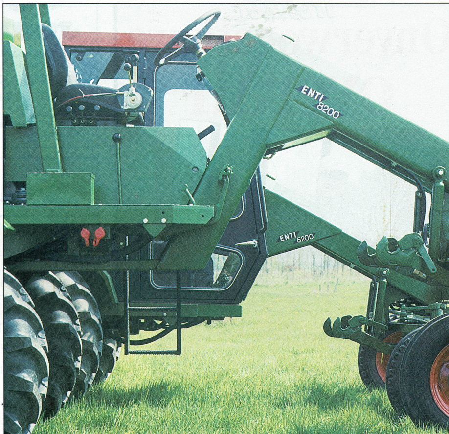
De grote bodemvrijheid is het sterke punt van de Enti tooltrac. De 8200 heeft een bodemvrijheid van 80 cm en de 5200 40 cm. De 9200 met een bodemvrijheid van 120 cm ontbreekt op de foto

De wendbaarheid van de trekker is opvallend. De kleine draaicirkel gekoppeld aan de eenvoudige richting- verandering zijn hier de bet aan.