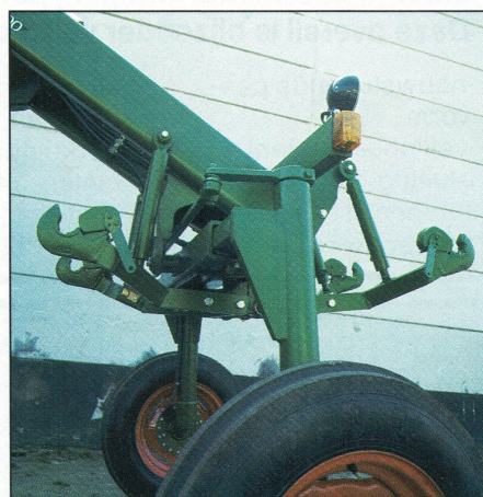
De Enti is standaard uitgevoerd met middenhef, de fronthef wordt als één van de opties geleverd

ontbreken in de standaarduitvoering maar zijn als optie leverbaar. Een Nederlandse akkerbouwer kan deze trekker alleen gebruiken voor verzorgingswerkzaamheden zoals schoffelen en spuiten. Het prijskaartje dat er dan aanhangt is hoog (op de Duitse markt, waar Enti de trekker zelf verkoopt, kost een 5200 f 49.000). Als gevolg van strengere milieuwet-