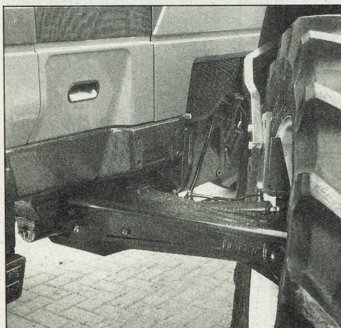
De draaicirkel is met 11 meter bij een spoorbreedte van 1,70 meter aan de ruime kant. Bij 1,50 meter spoorbreedte verandert de draaicirkel niet

Importeur Fiatagri Nederland bv Gladsaxe 25 Postbus 20076 7302 HB Apeldoorn tel. (055) 45 12 42