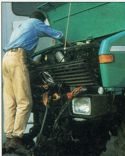
Dagelijks onderhoud bij de Unimog. Een trapje is nodig om met sleutels de motorkap te verwijderen

Bij de JCB klappt de motorkap zo weg. Filters en dergelijke zitten vrij hoog, en je moet je tussen de wielen wringen. □