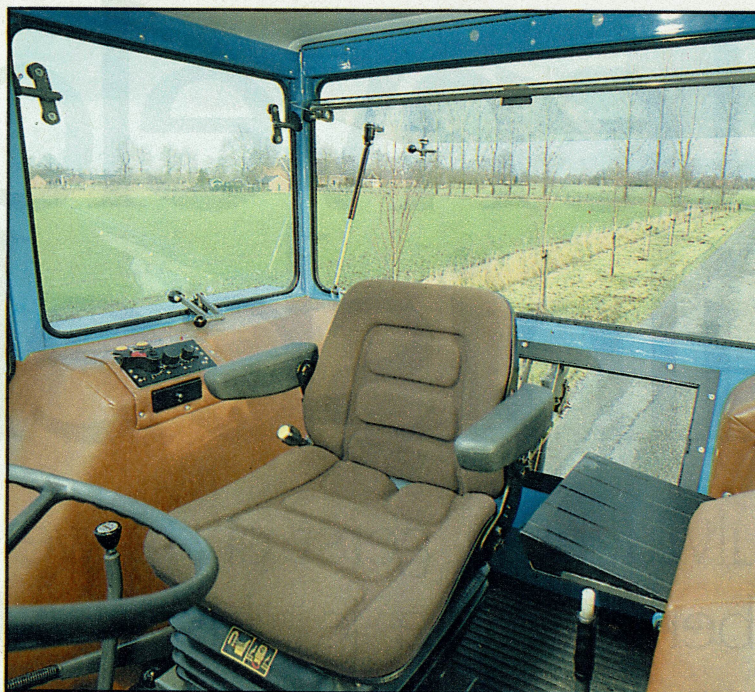
De ruimte in de Eicher-cabine is enorm groot. De bijrijderszit is opklapbaar en vormt dan een functioneel geheel met de cabinewand

Boven de kipperknobbel zit een 'borgpen'. Wil je die aanbrengen of verwijderen, dan kan het gebeuren dat de trekstangen van de hef in de weg zitten. Om de knobbel te kunnen benutten, moet ook de zwaaiende trekhaak weg. Volgens de dealers hoeft je daarvoor niet persé onder de trekker te kruipen.