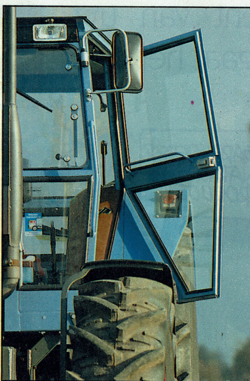
De in- en uitstapruimte is vrij beperkt vanwege de buitenspiegel (die in de weg zit) en de deur die niet al te ver open kan. Een voordeel van het laatste is wel dat hij weinig buiten de trekker uitsteekt

Testers: Willem C. Angenent en Henk Beunk