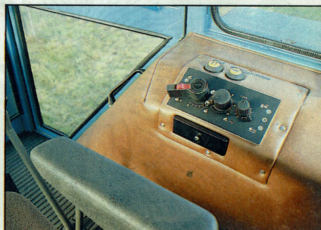
Voor bediening van de elektronische hef beperkt Eicher zich tot drie knoppen. Dat is niet zo handig als het lijkt. Elke knop heeft namelijk een dubbele functie