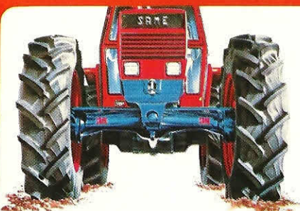
2 x M-IV-81 - CONDOR 55 - K&H

SAME FRANCE -Zone Industrielle de Moissy-Cramayel - Avenue Albert Einstein 77550 - Moissy-Cramayel - Tel. 16 (6) 060.00.10 Telex pieces de rechange: 691 631 F TRACSAM Telex autre services: 691 675 F TRACSAM IN BELGIË: Depot voor trekkers en wisselstukken Steenweg op Brussel 5 9402 MEERBEKE-NINOVE Tel. 054 - 321479