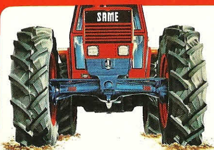
6 x M-VH - '82 - CENTAURO 70 EXP. - K&H