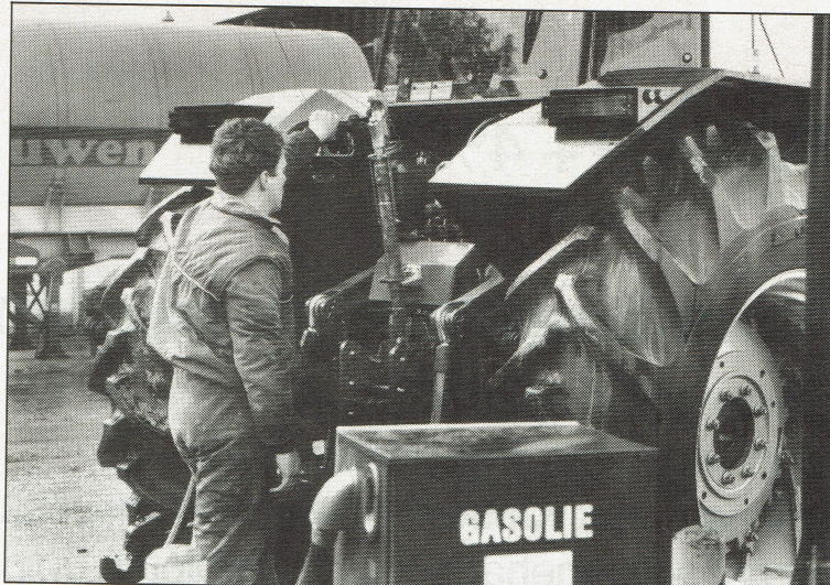
Nog altijd zit de vulopening van de brandstoftank lastig hoog

De autotronic, waar we al enkele functies van zijn tegengekomen (hef, transmissie en aftakas), ontlast de chauffeur. Bij de assen komen we de nuttige functies van de