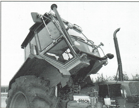
Voor onderhoud van motor en achterbrug is de cabine te kantelen. Onderdelen als peilstokken en filters zijn hierdoor goed bereikbaar