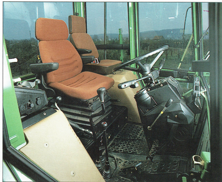
De 395 GHA heeft een ruim bemeten cabine. Hierdoor is er zelfs voldoende plaats voor een luxe bijrijderszit die als extra leverbaar is