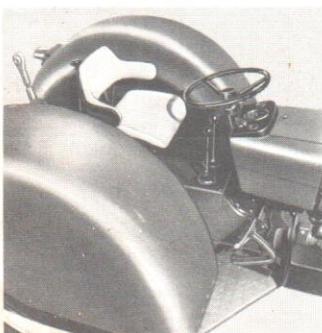
Het ruime platform biedt uitstekend rijcomfort.

JOHN DEERE biedt U met deze 2020 een krachtige fruitteelttrekker die U alle voordelen biedt welke U in de fruitteelt nodig hebt. Nu en in de toekomst.