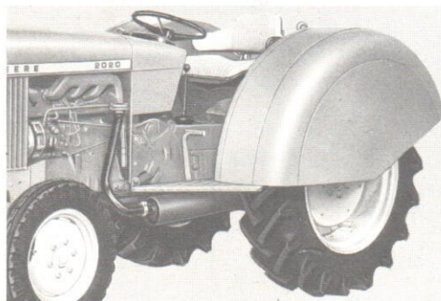
De gladde uiterlijke vormgeving voorkomt dat takken en fruit worden beschadigd.