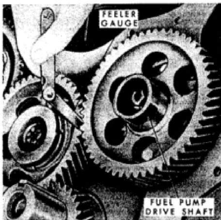
Fig. 74-Timing gear backlash can be checked with dial indicator or with feeler gage as shown. Be sure to check backlash at several points around the gear.

77. Om de kap van het distributietandwiel te verwijderen, kap verwijderen, koelsysteem aftappen en ontkoppel radiator en aan voorzijde gemonteerd luchtfilter slang. Op modellen met trans- missie oliekoeler, verwijder rooster en Koppel de koelbuizen los van de radiator onderste tank. Koppel de batterijaarde los