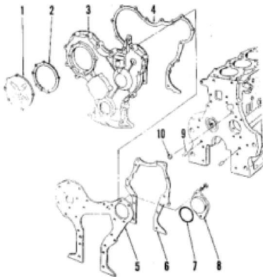
Fig. 73-View of timing gear cover and engine front plate installation. On non-diesel engines, governor assembly is used instead of plate (1). On models without power steering, plate (8) covers hole in engine front plate (5).